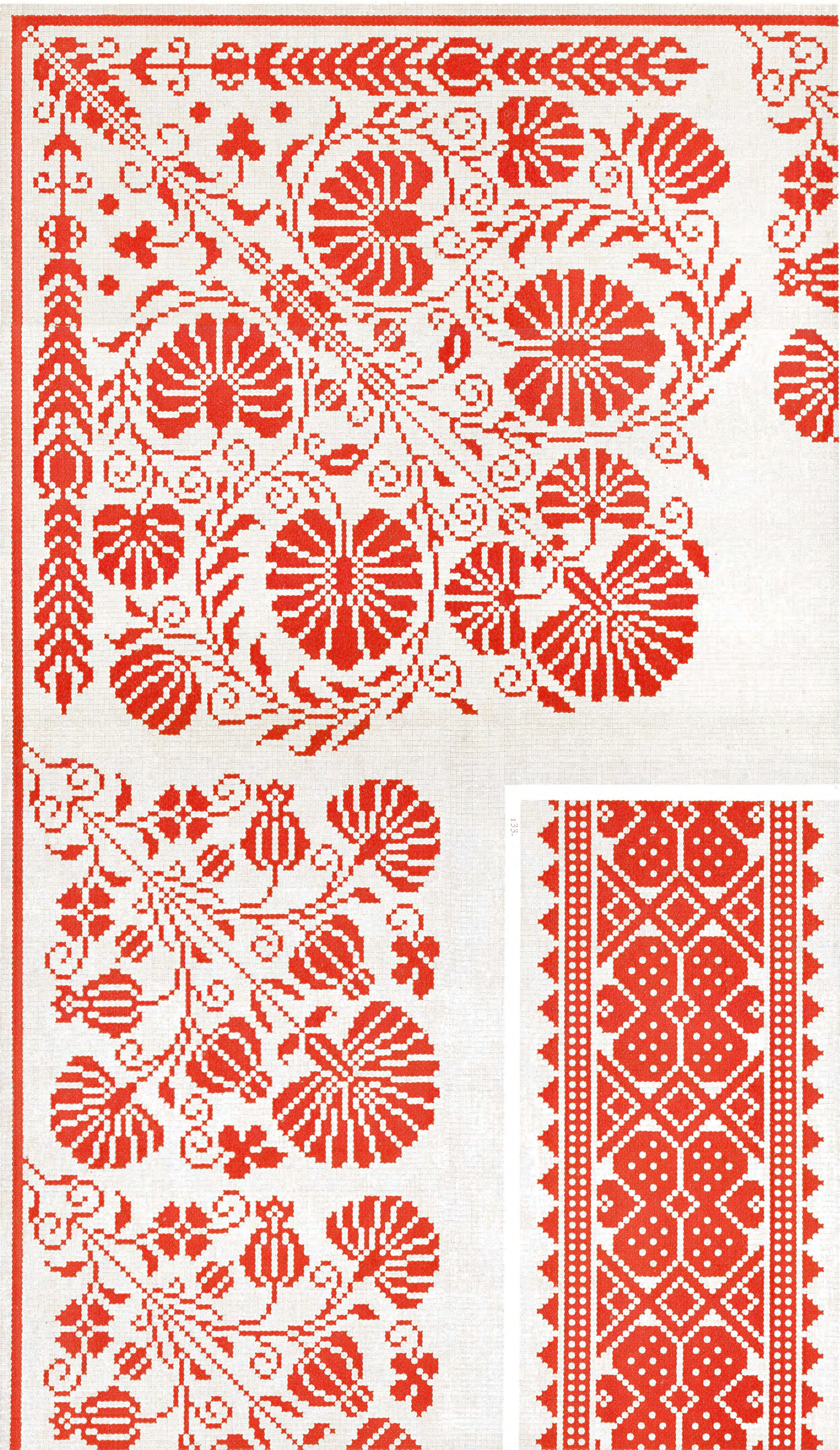
Rouge-Turc D.M.C N° 321